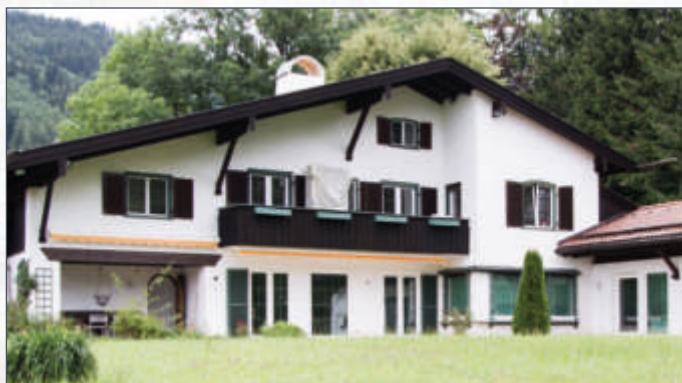
Villa am Tegernsee