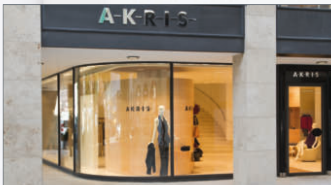
Modehaus Akris, München